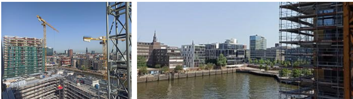
SKAI in Hamburg

Besonderheiten: Die Türme wurden mit dem Umweltprädikat Hafencity Hamburg GmbH (HCH) in Gold ausgezeichnet.