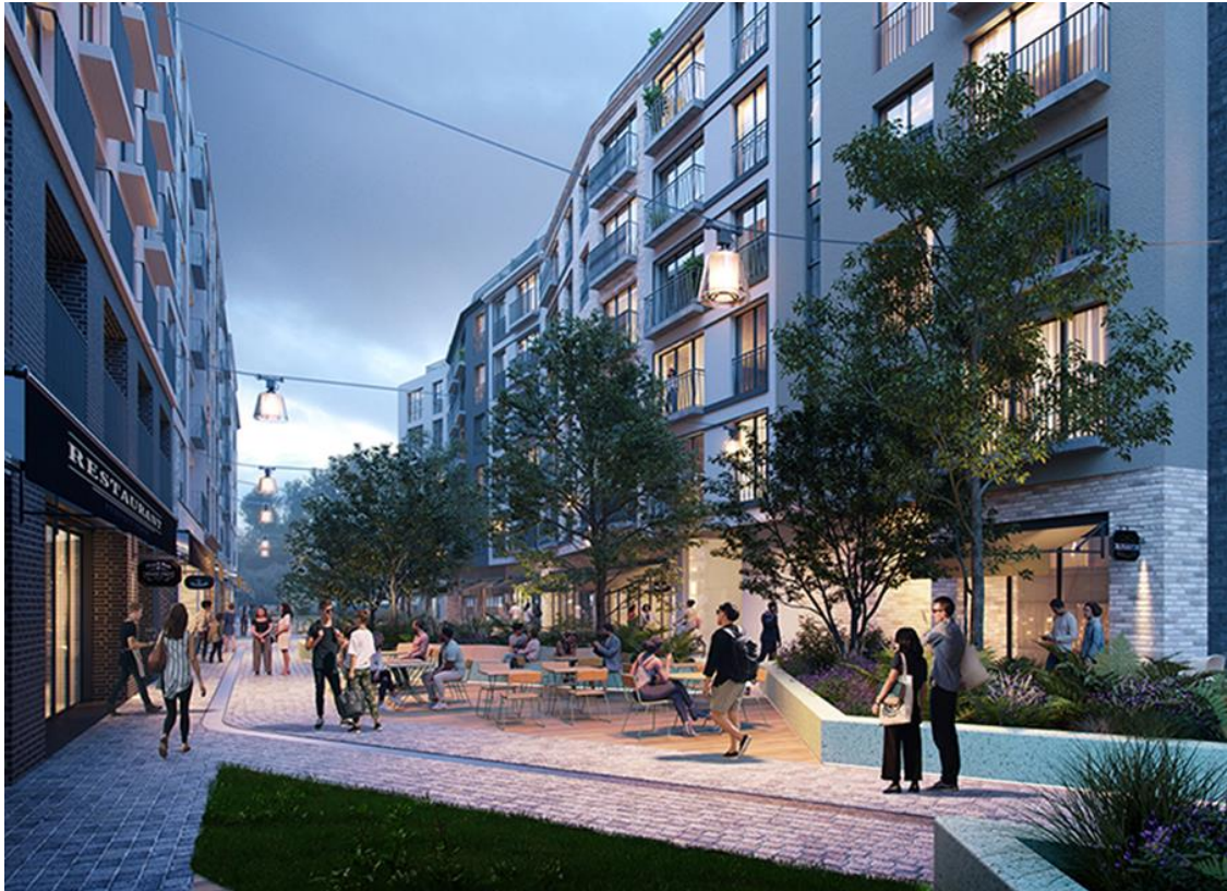
Mainyard in Frankfurt

Projekt: Quartiersentwicklung im Allerheiligenviertel Frankfurt